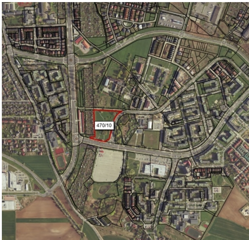
Ryc. nr 1

Orientacyjne położenie (Rycina Nr 1) i granice Parku 100-lecia Odzyskania Niepodległości (Rycina 2)